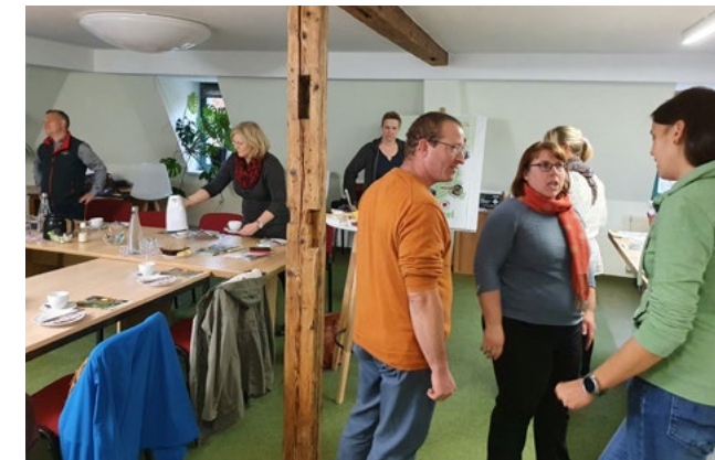
Mitte Oktober funktionierte hier noch Präsenz, um sich über alternative Verkaufsmöglichkeiten auszutauschen.

Das Thema Lebensmittelautomaten ist kein neues Thema, jedoch – schon aufgrund der notwendigen Einschränkungen während der Pandemie – so aktuell wie nie. Hinzu kommt, dass sich das Wertgefühl für regionale Produkte enorm erhöht hat, sowohl für Einwohner als auch für Touristen. Das Thema Vermarktung regionaler Produkte unterstützt der Landschaft(f)t Zukunft e. V. schon seit Jahren – die Datenbank „Gutes von hier.“ mit ihren Partnern arbeitet als erfolgreiches Netzwerk.