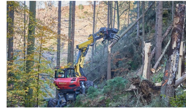
Es sieht gewaltig aus, ist aber doch bodenschonend, der Einsatz mit dem Schreitbagger.

Aber: Das Spezialgerät ist ein Unikat in Deutschland, mit Goldstaub aufzuwiegen und die Auftraggeber stehen Schlange. Parallel zum Agieren im Gelände ist durch die Nationalparkverwaltung seit Juli eine umfassende Analyse der gekennzeichneten Wege erfolgt.