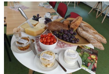
Was braucht es mehr, als eine regionale Mixtur auf dem Gabentisch.

Am 12.10.2021 trafen sich auf Einladung des Landschaft(f)t Zukunft e. V. Interessierte aus der Region, um die unterschiedlichen Bedarfe, Wünsche und Vorstellungen, aber auch Erfahrungen und Ausbaumöglichkeiten zu besprechen. Auf der Grundlage bereits bestehender Netzwerkbeziehungen, der neu entstan-