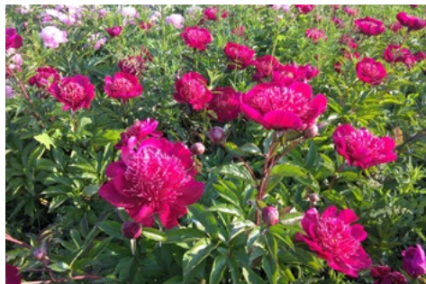
Die Kraft von natürlicher Farbe ist nicht zu unterschätzen.