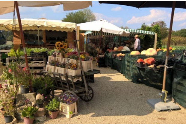
Im Sommer war Schatten noch willkommen. Jetzt, Anfang Dezember, ist die wärmende Sonne Mangelware.

Mit der Narzissenblüte im März startet der Verkauf von Blumen, Gemüse, Kartoffeln, Gartenpflanzen und verschiedenen Obstsorten an der Lohmener Straße in Pirna und endet, wenn das große Kürbisgeschäft zu Halloween abgeschlossen ist.