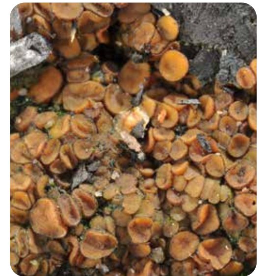
Erstbesiedler auf den Brandflächen innerhalb der ersten Wochen 2022 nach dem Löschen