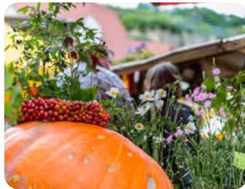
Mehr Kürbisse dann zum 27. Naturmarkt Sächsische Schweiz am 1.9.24 in Stadt Wehlen.

Das Regionalmanagement Sächsische Schweiz beteiligt sich dieses Jahr wieder mit einem eigenen Stand zum 27. Naturmarkt Sächsische Schweiz in Wehlen, der am 01.09.2024 stattfindet. Kommen Sie gern vorbei und genießen den Tag beim Bummeln über den Markt mit seinen vielfältigen Angeboten an regionalen Produkten, Kulinarischem und viel Wissenswertem.