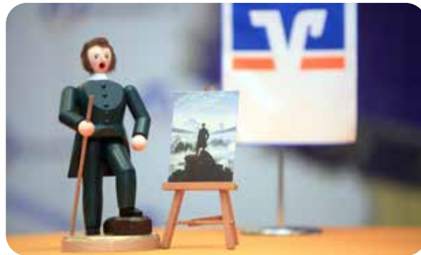
Der rauchende Friedrich darf ab Dezember seine innere Kerze anzünden!

Was hat Caspar David Friedrich mit Canaletto gemeinsam? Beides waren Maler, deren Werke durch die Sächsische Schweiz inspiriert wurden. Und was noch? Es gibt ihn nun auch als Räuchermann exklusiv bei der Volksbank Pirna eG.