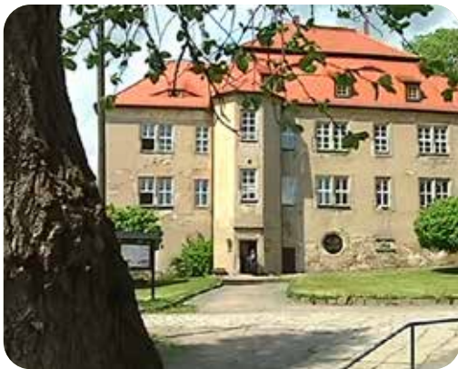
Das Schloss Struppen vor der Sanierung.

Hier stellen wir Ihnen einige Netzwerkpartner von „Gutes von hier.“ vor und lassen diese aus dem Nähkästchen plaudern.