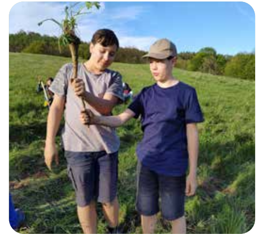
Die lange Wurzel erfordert viel Kraft beim Ziehen.

Die Staudenlupine, Lupinus polyphyllus , ist eine prachtvolle Blütenstaude und eine alte Bekannte aus unseren Gärten. Schon zu Beginn des 19. Jahrhunderts hat die in Amerika beheimatete Pflanze durch die Entdeckerfreude englischer Naturwissenschaftler ihren Weg nach Europa gefunden. Neben ihrer Blütenpracht besitzt sie weitere interessante Eigenschaften. So ist sie mit ihrer langen Pfahlwurzel in der Lage, Böschungen zu stabilisieren und Erosionen zu verhindern. Solche ingenieurbiologischen Maßnahmen, ihre Verwendung als Äsungspflanze im Forst und ihre Einbringung als Bodenverbesserer haben in der Vergangenheit zur Ausbreitung in der offenen Landschaft geführt. Hier kann die Staudenlupine aber sehr problematisch für die heimische Pflanzenwelt werden. Breitet sie sich auf bisher artenreichen Wiesen aus, kann sie durch Stickstoffanreicherung des Bodens und starken Konkurrenzdruck heimische Pflanzenarten langfristig verdrängen. Somit verringert sich das Nahrungsangebot für eine Vielzahl heimischer Insektenarten. Die schönen blauvioletter Flächen gehen leider zugleich mit einem Verlust an Vielfalt heimischer Flora und Fauna einher. In Kooperation mit dem LPV Sächsische Schweiz-Osterzgebirge e.V. organisierten wir Beteiligungsaktionen mit Freiwilligen,